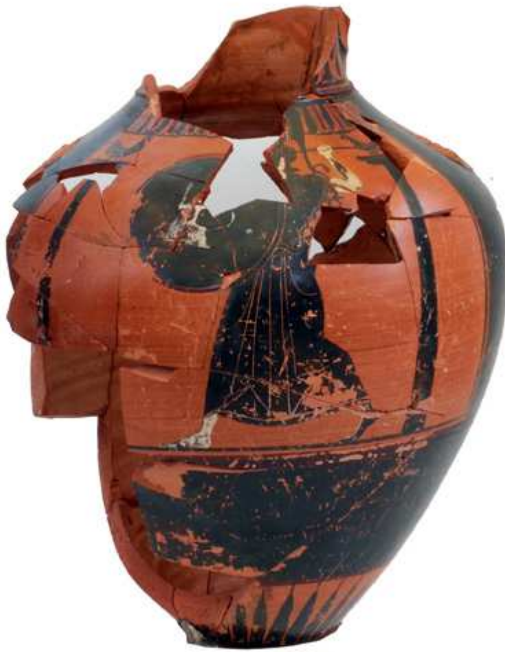
Amphore pseudo-panathénaique découverte dans un puits du sanctuaire