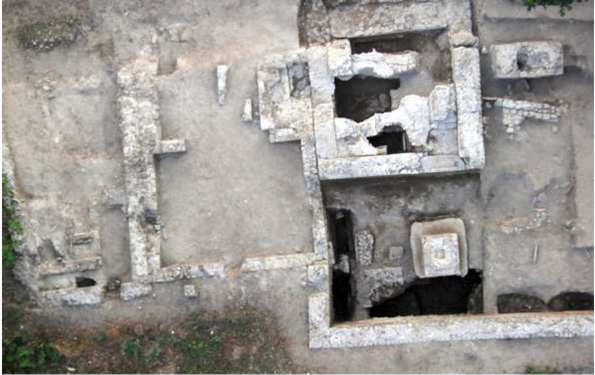
Cumes : les mausolées D48, D34 et D35