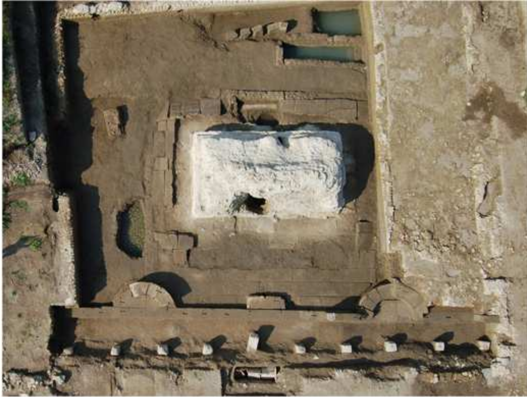
Le mausolée A63 et son enclos en tuf. Début de l'époque Augustéenne