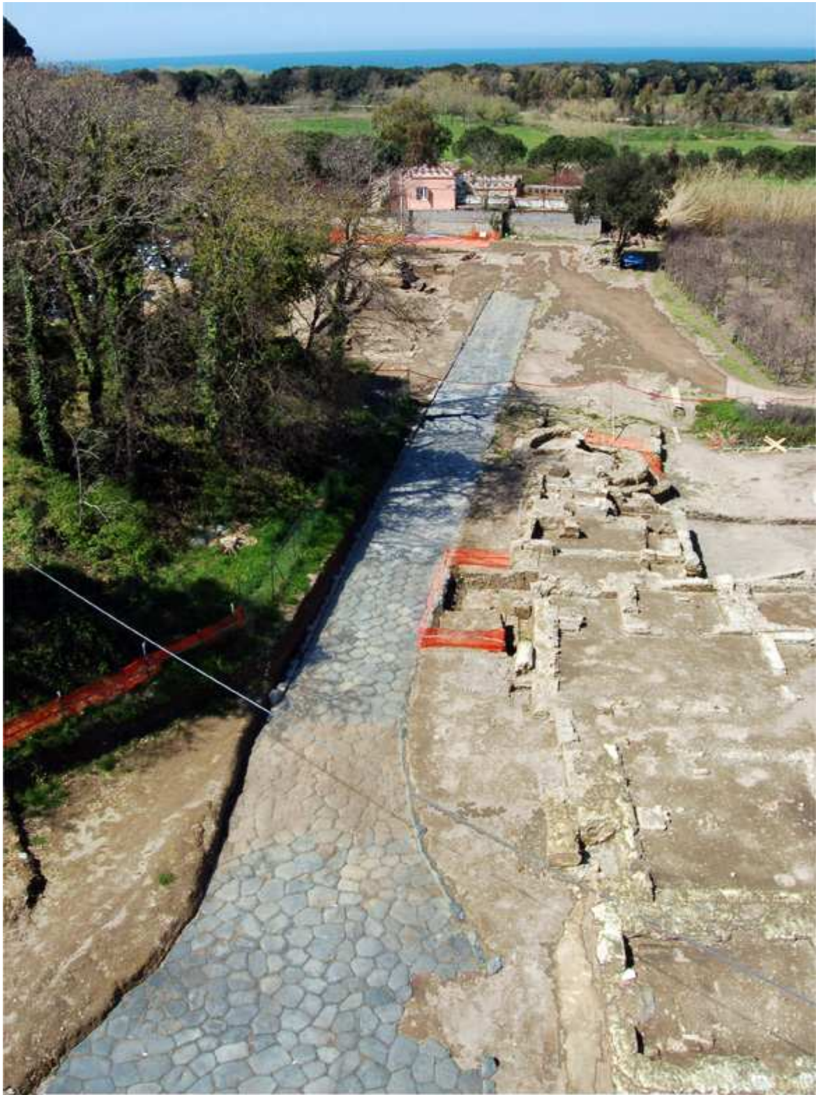
La voie domitienne et les mausolées romains qui la flanquent