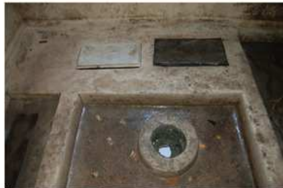
Intérieur de la chambre funéraire ci-dessus : les vasques en marbre servant d'urnes cinéraires