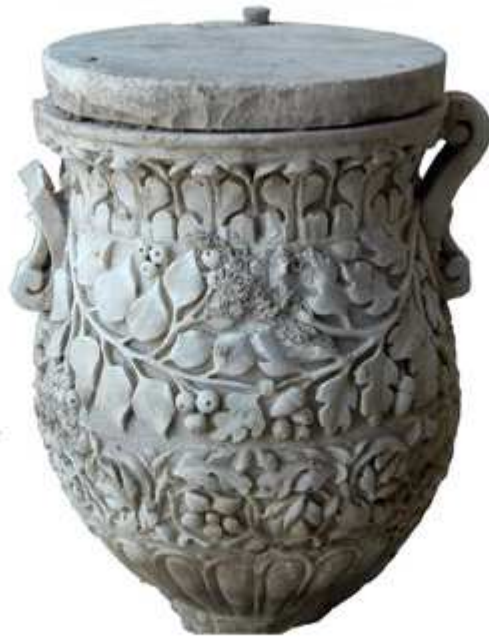
Cumes : urne en marbre du I er siècle de notre ère provenant du mausolée D48