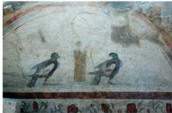
Arcosolium orné d'une peinture représentant deux pigeons de part et d'autre d'un panier de fleurs