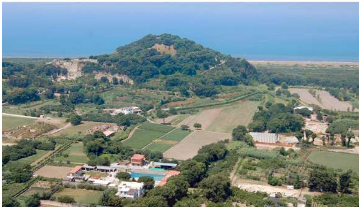
Cumes: vue générale prise de l'est. Au centre, l'acropole, à gauche le forum, à droite les fouilles du Centre Jean Bérard