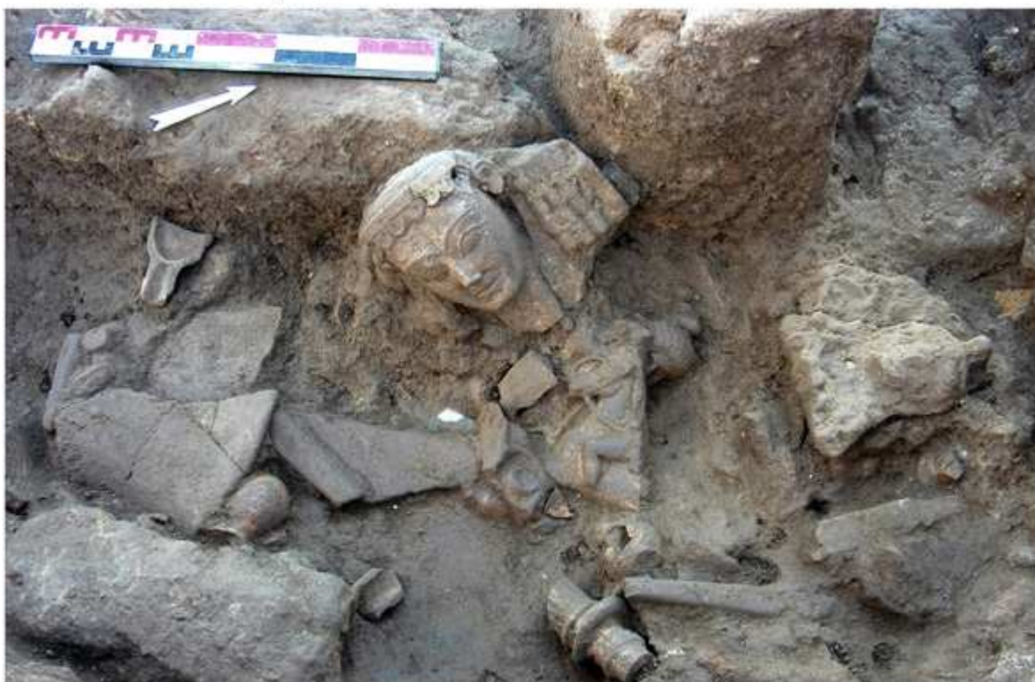
Cumes : sanctuaire, fosse contenant des antéfixes et des objets votifs