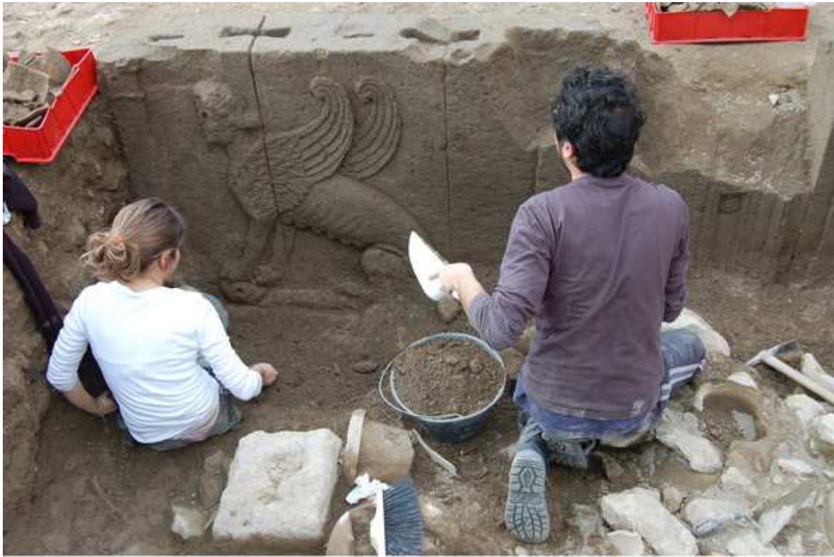
La découverte du bas-relief au sphinx