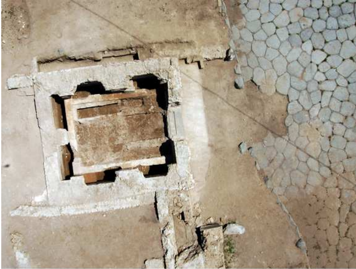
Vue par ballon du mausolée A41 ouvrant sur la place Epoque sévérienne