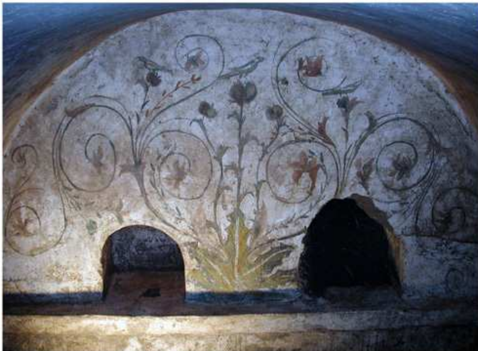
Cumes : peintures du mausolée D50. Epoque Tibéro-Claudienne