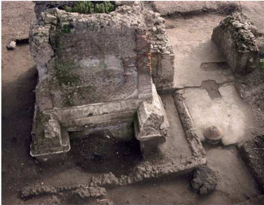
Cumes : Mausolées D34 et D50