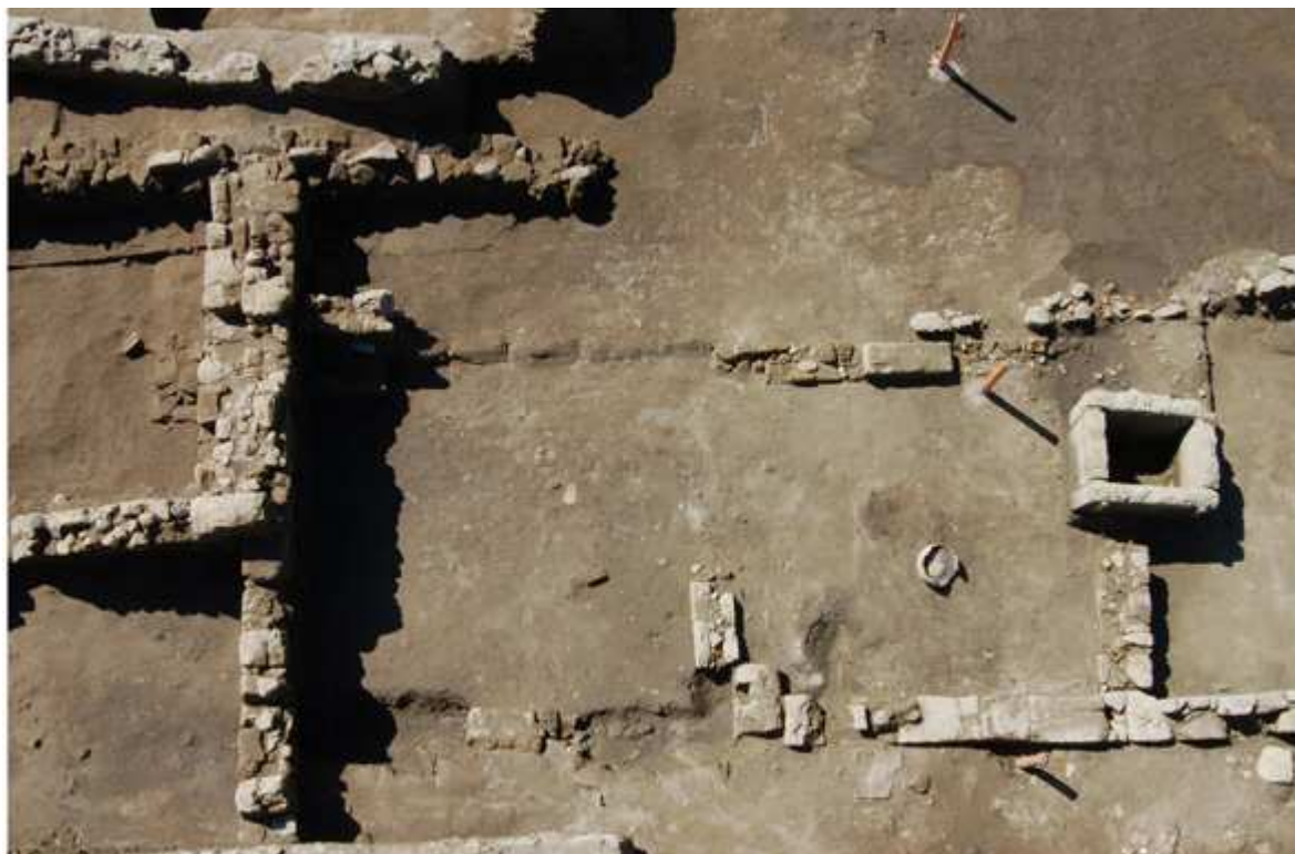
Cumes : vue partielle des niveaux et murs du sanctuaire du Ve au IIIe siècle