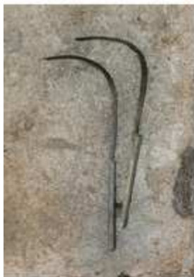
Une partie du mobilier funéraire les strigiles de bronze