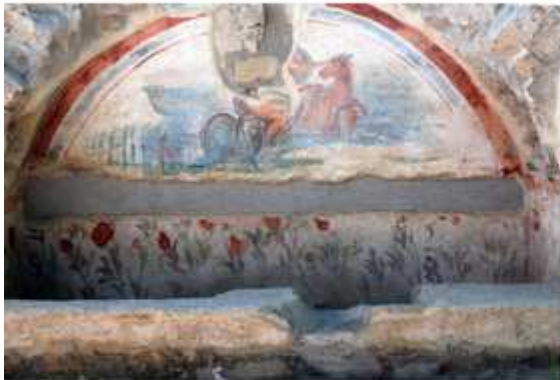
Arcosolium orné d'une peinture représentant une néréide chevauchant un monstre marin