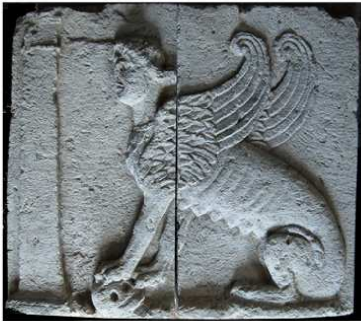
Le bas-relief représentant un sphinx