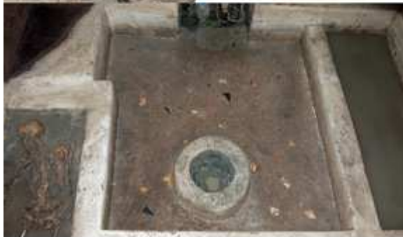
à gauche : le pavement et la sépulture à inhumation