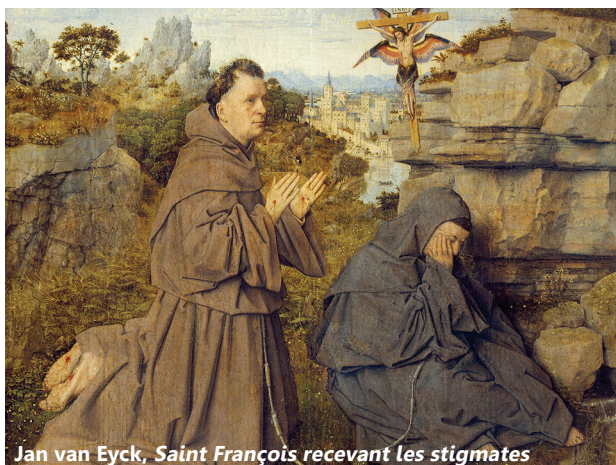
Jan van Eyck, Saint François recevant les stigmates