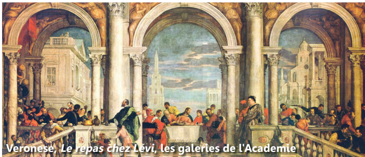
Veronèse, Le repas chez Lévi, les galeries de l'Académie