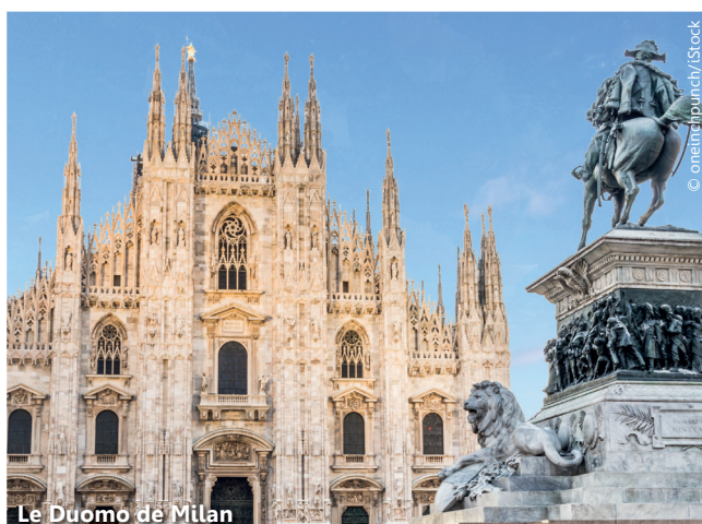
Le Duomo di Milano