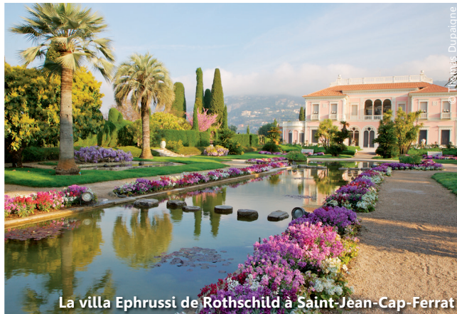
La villa Ephrussi de Rothschild à Saint-Jean-Cap-Ferrat