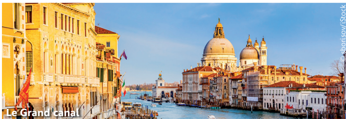
Le Grand canal